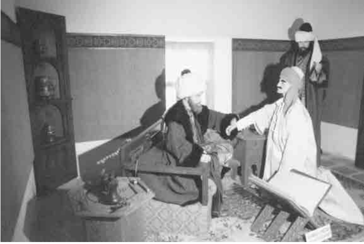
Bayezid külliyesinde Hekim Başına gösterilen bir hasta