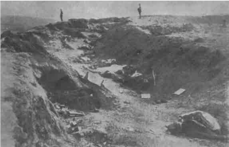
Karargahta şehit olmuş bir kaç asker

Yara gitgide büyüyerek kanamaktadır. İşler içinden çıkılmaz bir vaziyet almıştır. Kendisinden payitahtın kırk gün muhafazası istenmesine rağmen; şanlı ihtiyar, aksakallı nurlu dede ise tam beş ay beş gündür askeriyle, süpürge tohumundan, kuş yemin-den ekmek yiyerek kaleyi muhafaza etmiştir. Fakat yiyeceğin bitmesine bu sefer cephanenin tükenmesi de eklenince yapılacak bir şey kalmamıştır.