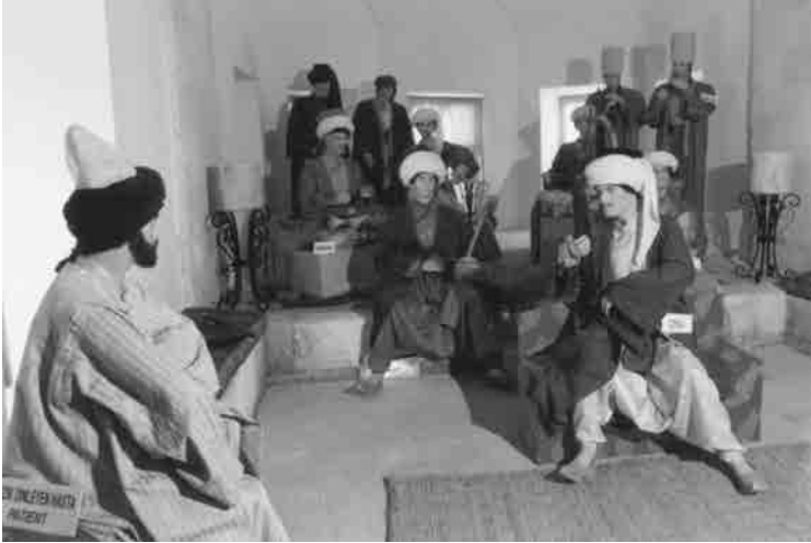
Bayezid Külliyesinde müzik sesiyle tedavi edilmeye çalışılan hasta

Nizamü'l-mülk medreselerinden sayılabilecek olan Bayezid Külliyesi de, mescit veladetli ilim yuvalarının en düzenlisi sayılabilir; zira oralarda bir taraftan Gazali'nin getirdiği ruh ve mana temsil ediliyor, diğer taraftan, çağın ilimleri değerlendiriliyordu. Akıllar, fen ve tekniğe ait ilimler ile, kalpler dinî ilimlerle nurlandırılıyor. Ve talebenin himmeti coşturuluyordu ve bu kalp-kafa izdivacından İbn-i Sinalar, Raziler, Biruniler, Battaniler, Zehraviler yetişiyordu. Bayezid Külliyesinde de tıpla uğraşanlar üzerlerine düşen vazifeyi en iyi şekilde eda etmişlerdi. Oraya zincirlere vurulu bir şekilde getirilen akıl hastalarına; Neva, Rast, Dügah, Cargah, Suzıralı gibi dini musikilerle tedavi uygulanır ve böylece hasta iyileşir, şifa bulurdu. O günkü Avrupa'da ise durum bunun tam tersi idi; orada akıl hastaları yakılır iken burada musiki ile iyileşti rilmenin temelinde, İslâm'ın manevî gücü, müsbet bilimi vardı. Hak inancı ile müsbet ilmin kaynaştırılıp uygulanmasından müsbet sonuçlar meydana geliyordu.