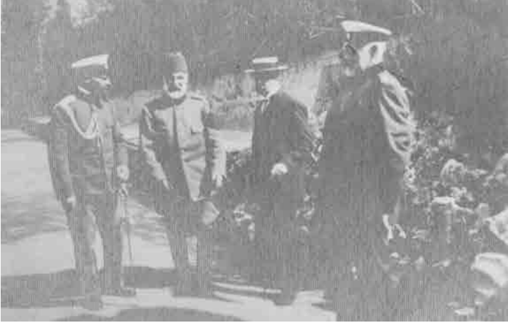
Şükrü Paşanın esir düştükten sonra Kral Ferdinand'la çekilmiş fotoğrafı

Yaşlı kahraman Şükrü Paşa, Sofya'ya tutsak olarak gönderilirken, onun askerleri de Tunca Nehri üzerinde bulunan Sarayıçî'ndeki ağaçların arasında toplatılmıştır. Binlerce kişi bu savunmasız yerde açlık ve işkence zulmü ile baş başa kalmıştı. Tutsak askerlerimiz artık yavaş yavaş açlık ve gıdasızlıktan ölmeye başlar. Geriye kalanlara da sekiz tanesine bir ekmek düşecek şekilde ekmek dağıtılır. Aç ve çıplak vaziyetteki binlerce kişi ellerinin ulaşabildiği yerlere kadar ağaç kabuklarını sökerek, kemirerek onları yemeye başlarlar. Bu arada, kolera, dizanteri v.b. bulaşıcı hastalıklardan her gün yüzlercesi kıvranarak ölmekte ve cesetleri günlerce açıkta, kurda kuşa yem olmakta idi.