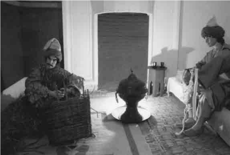
Bayezid külliyesinde çalıştırılarak tedavi edilmeye çalışılan hastalar

Bayezid Külliyesi de hoşgörü abidesi olmaya namzet şahsiyetler tarafından inşa ettirilerek, kendi devrinde eşi-menendi az bulunan Darü's-şifalardan olmuştur. Bu Darü's-şifalarda ilim son haddine erişmiş ve kendi çağından bu yana yüz yıllar geçmesine rağmen, ismi yad edilen birçok şahsiyet yetiştirmiştir. Bugünkü Tıp fakültelerine benzer, o günkü külliyelerde yetişmiş olan İbn-i Sina, Razi ve Zehravi gibi ilim otoritelerinin eserleri, Batının ilmi yapılanmasında önemli katkıları sağlamıştır. Daha sonra bin bir iddia ile hazırlanıp ve en debdebeli bir eda ile ortaya sürülen kitaplardan hiçbirisi bin sene ellerde dolaşma bahtiyarlığına ermemiştir ama, İbn-i Sina sekiz asır; Zehravi, tam bin sene batıda otorite olarak kabul edilmişlerdir.