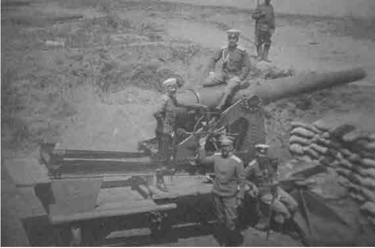
Kaybedilen siperlerimizden bir tanesi

saldırılarına sürekli devam ediyorlardı. Bu saldırılara karşılık subaylarımız; yorgun, uykusuz, gıdasız, olmalarına rağmen düşman saldırısına insan üstü bir gayretle karşılık vermekte idiler. Kale Komutanımız ve askerleri, bu güzel şehri Bulgarların çamurlu çizmeleri ile çiğneyeceğini hayal ettikçe çılgına dönüyorlardı. Allah Allah nidalarıyla saldıran kahraman Mehmetçikler eriyi eriyi yok olmaktaydılar. Bütün siper ve mevziler yavaş yavaş elden çıkmaya başlamıştı.