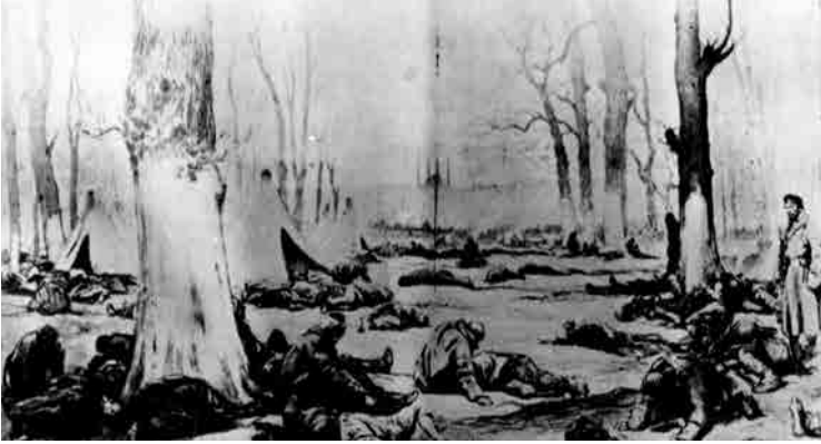
Savaş sırasında esir düşüp açlıktan ağaç kabuğu yiyen askerlerimiz

Siz, ey başını dahi destar etmeyip de feda, Onunla Alem-i lahuta yükselen şüheda! Ne mutlu sizlere: dünyada çok ölüm gördüm; Tahattur etmiyorum böyle kahraman bir ölüm.